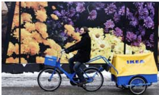
IKEA i Danmark tilbyder udlejning af cykler og cykelanhængere.